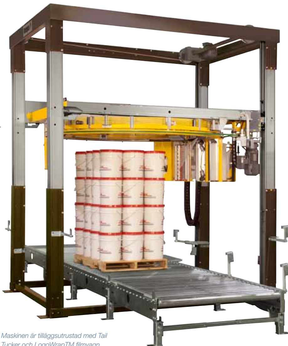
Maskinen är tilläggsutrustad med Tail Tucker och LogoWrap™ filmvagn.

Stark ramkonstruktion av aluminium och välbalanserad ring med lyftremmar, garanterar en tyst, effektiv och driftsäker produktion med ett minimalt behov av underhåll